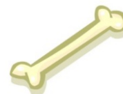
OS ET RESTES DE VIANDE