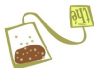
THE EN SACHETS OU EN VRAC