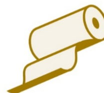
ESSUIE-TOUT ET SERVIETTES EN PAPIER

Les huiles et graisses alimentaires usagées ne sont pas acceptées et doivent faire l'objet d'une collecte et traitement à part