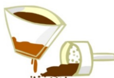
MARC ET FILTRES A CAFE