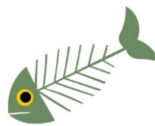
ARETES ET RESTES DE POISSON