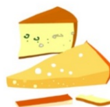
CROUTES DE FROMAGE